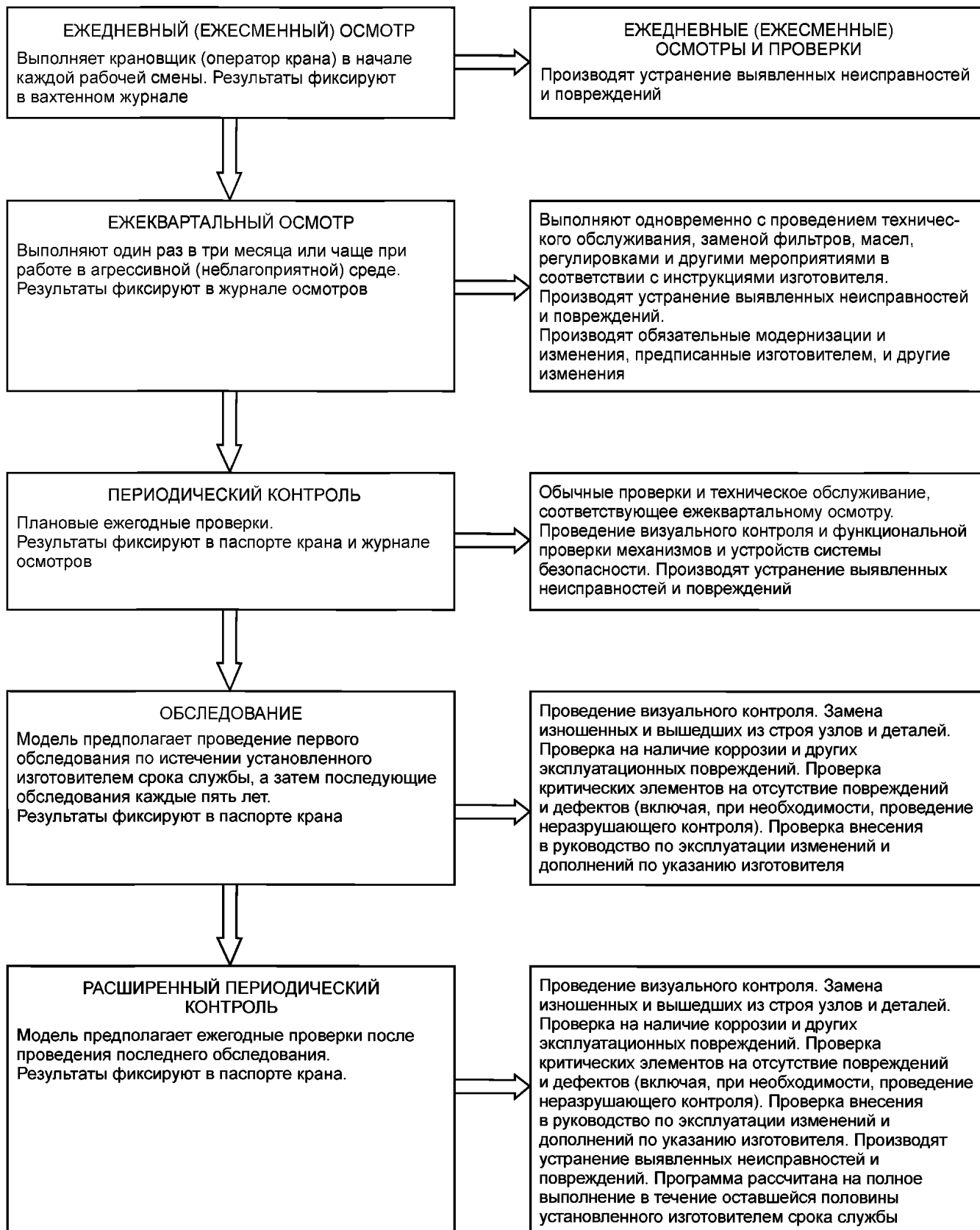
Рисунок Б.3 — Проведение технического контроля для кранов, отработавших более половины установленного изготовителем срока службы, в тех случаях, когда принята схема проведения технического контроля с применением обследования и, в дальнейшем, расширенного периодического контроля, а инструкции изготовителя отсутствуют или признаны некорректными