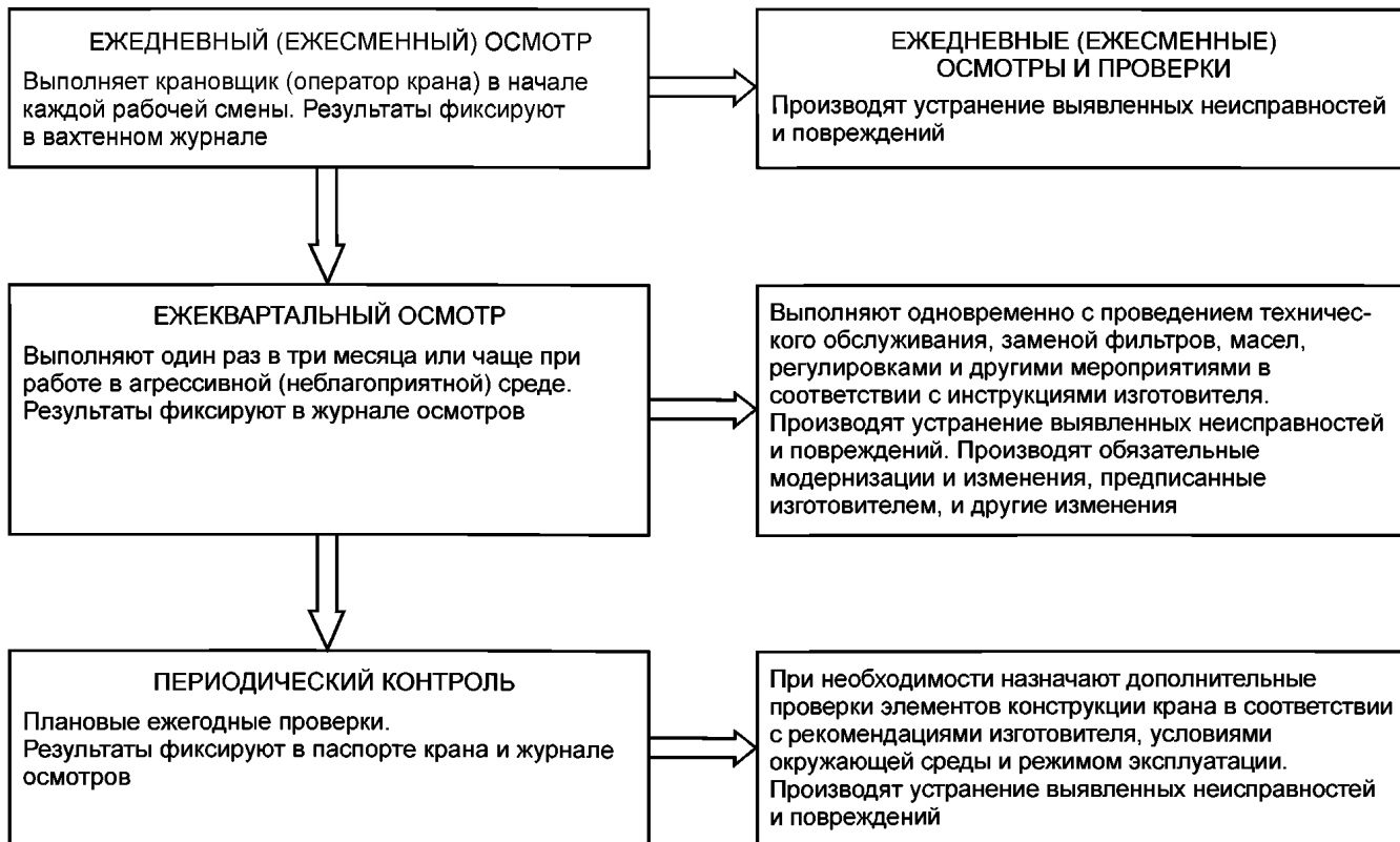
Рисунок Б.1 — Проведение технического контроля при наличии инструкций изготовителя